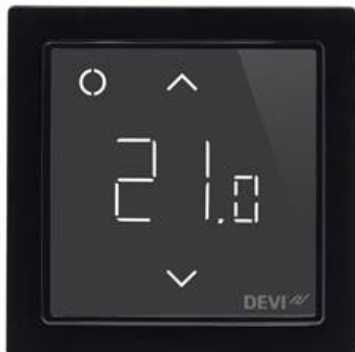
Рис. 2. Внешний вид электронного терморегулятора DEVIreg™ Smart.

Внешний вид терморегулятора представлен на Рисунке 2: