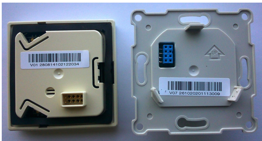
Рис. 1. А. Вид стикеров на корпусе модуля индикации и на модуле питания терморегулятора.

Дата изготовления указана на стикерах, расположенных на внутренних поверхностях модуля питания и модуля индикации терморегулятора, а также на упаковочной коробке (Рис. 1).