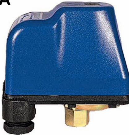
Реле давления РА 5 MI