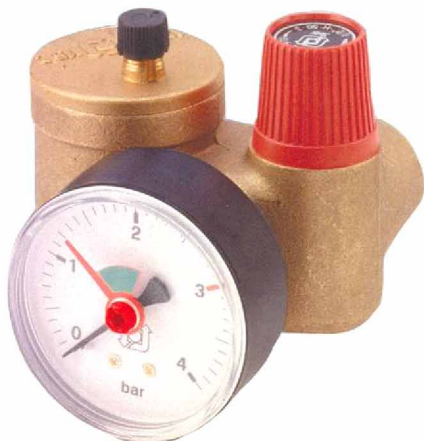
KSG 30 N