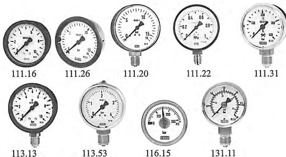
Рис. 1 Внешний вид манометров