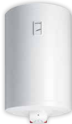
TGR NG НАПОРНЫЙ ЭЛЕКТРИЧЕСКИЙ ВОДОНАГРЕВАТЕЛЬ