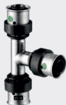
Тройник Viega Smartpress с SC-Contur - нержавеющая сталь - пресс-соединение Модель 6718