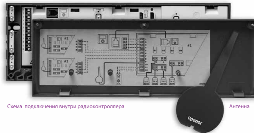
Схема подключения внутри радиоконтроллера

Радиоконтроллер C-56 предназначен для использования функций DEM в сочетании с панелью управления I-76. Обеспечивает прием и обработку радиосигналов от радиотермостатов и управление исполнительными механизмами на 24В. Кроме того, связку «радиоконтроллер + панель управления» можно расширить дополнительными радиоконтроллерами. Возможно подключение к одной панели управления I-76 до 3 радиоконтроллеров C-56.