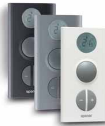
Радиотермостат T-75 с дисплеем

Термостат отображает температуру в помещении или заданную температуру. Предварительная установка температуры выполняется с помощью клавиш +/- на передней панели. Датчик определяет "ощущаемую" температуру воздуха в помещении с учетом теплового излучения окружающих поверхностей и других источников тепла.