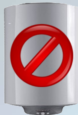
СТАНДАРТ Диаметр 450мм