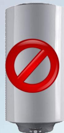
«СЛИМ» Диаметр 360мм