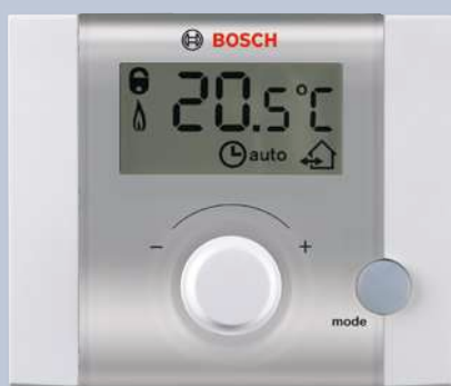
Комнатный регулятор FR 10 с ЖК-дисплеем обеспечит Вам полный контроль над системой отопления.

Данная серия регуляторов может быть встроена в котел, а может быть установлена в жилом помещении. Желательно, на самую холодную стену дома устанавливается датчик наружной температуры. Постарайтесь установить его так, чтобы избежать прямого попадания на него солнечных лучей, тепловых потоков из открытых форточек или дымовых газов из дымохода, выведенного на фасад. Далее на погодозависимом регуляторе выполняется настройка отопительной кривой и ее более точная подстройка спустя некоторое время. При этом регулятор хранит в своей памяти данные о прошедшей работе, накапливая тем самым практическую информацию о предпочтениях клиента и подстраиваясь под заданный режим работы.