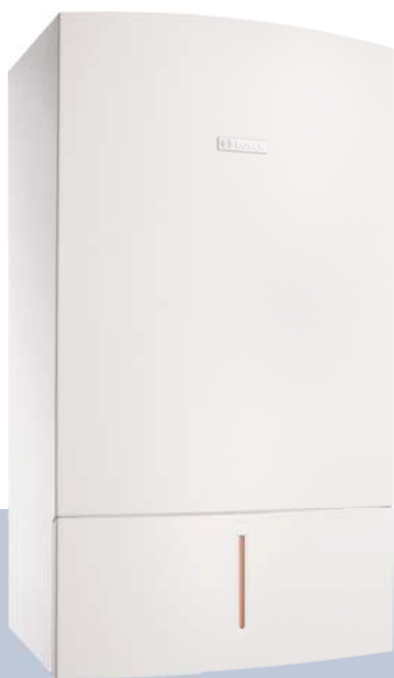
Condens 7000 W

Condens 7000 W работает чрезвычайно тихо и одновременно предлагает максимальный комфорт отопления и горячего водоснабжения на базе самой современной конденсационной техники. Отсюда - ценное свойство этого котла: Вы можете спокойно отдыхать дома и всегда ощущать эффект экономии энергии.