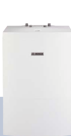
ST 120-2 E

Бойлеры косвенного нагрева, которые предлагает Bosch, являются проверенными на практике аппаратами для обеспечения горячей расходной водой. Вода нагревается отопительным котлом Bosch и накапливается в бойлере. Существуют различные типоразмеры и исполнения таких бойлеров. Следовательно, для каждого пользователя мы находим верное индивидуальное решение! Для особо высокого уровня энерго-эффективности при высокой комфортности горячего водоснабжения можно посоветовать клиентам наш высокопроизводительный бойлер с послойной загрузкой, встроенный в котел Condens 5000 FM и Condens 5000 FM Solar.