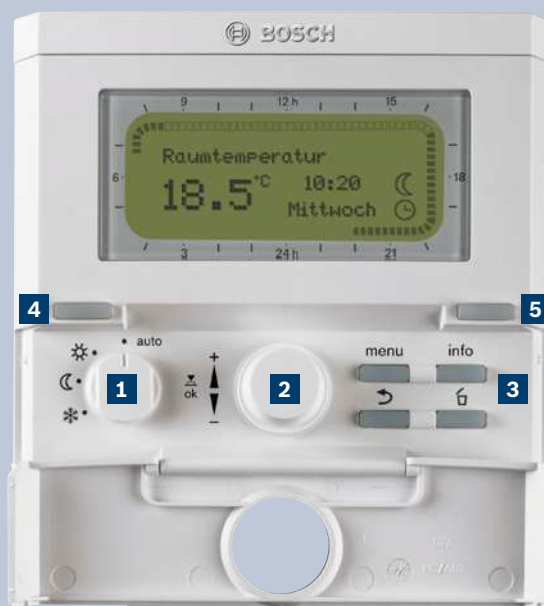
Погодозависимый контроллер FW200.