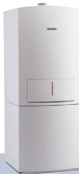
Condens 5000 FM, Condens 5000 FM Solar