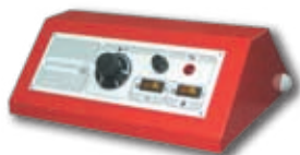
Пульт управления котла при работе с горелкой (опция)

Стальной водогрейный котел центрального отопления ЕКО-СКВ со встроенным бойлером из нержавеющей стали мощностью 30 – 50 кВт, работающий на твердом топливе (дрова, уголь). При снятии заглушки с нижней двери и установке пульта управления котел может работать с вентиляторной горелкой на солярке, газе или на пеллетах. Котел имеет лабиринтную конструкцию (топочная камера + 3 горизонтальных хода), позволяющую максимально использовать теплоту продуктов сгорания. При изготовлении котла применены качественные материалы и современные методы производства. Котел отвечает требованиям Европейских Норм EN 303-5.