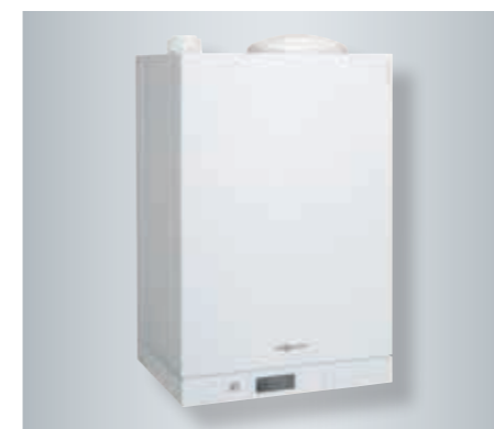
Котел Vitodens 111-W со встроенным 46-литровым емкостным накопителем