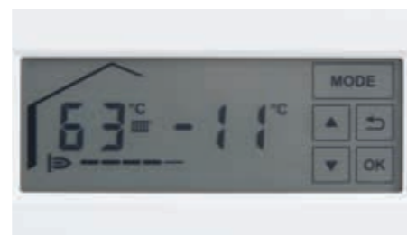
Жидкокристаллический сенсорный дисплей с подсветкой

Настенные газовые конденсационные котлы Vitodens 100-W и Vitodens 111-W управляются при помощи новой жидкокристаллической сенсорной панели управления с подсветкой. Даже в темном помещении легко считывать информацию с дисплея и комфортно пользоваться панелью управления.