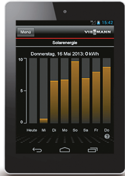
При использовании солнечных коллекторов можно посмотреть ежедневную нагрузку (планшет).