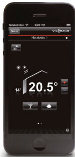
Закладка меню с прямым выбором температуры в помещении (пример iOS).