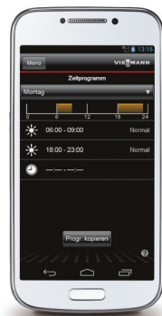
Меню программирования для включения и выключения установки.