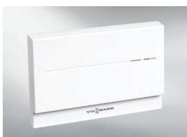
Коммуникационный модуль Vitocom 100 (тип LAN1)

В меню управления возможно задавать уставки температуры горячей воды. Также может устанавливаться время включения циркуляционных насосов.