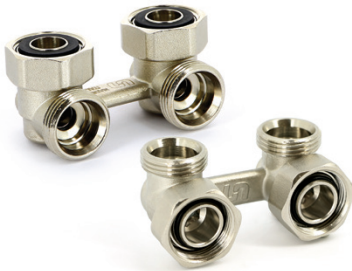
Узел угловой НВ для радиаторов со встроенными кранами