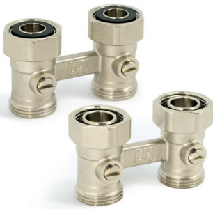
Узел прямой НВ для радиаторов со встроенными кранами