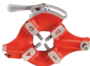
Модель № 713 Модель № 913