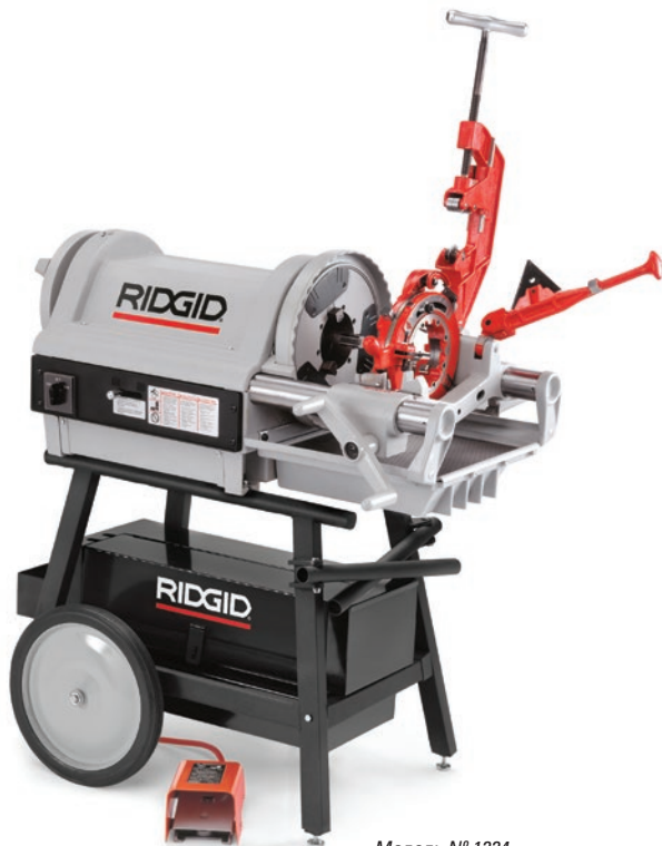
Модель № 1224