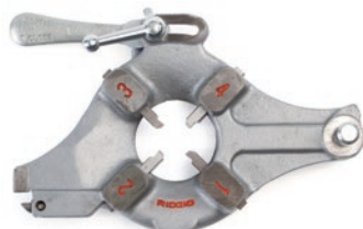
Модель № 541 Модель № 542