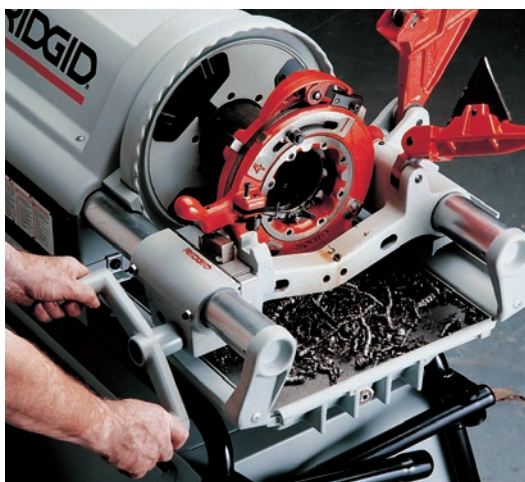
Резьбонарезная головка со ступенчатой регулировкой модели 714 (914).