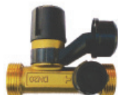
Ду 20 мм

Обязательно устанавливается на патрубке ввода холодной воды до отсекающей арматуры. Защищает ёмкость от повреждений при расширении нагреваемой воды.