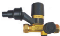
Ду 15 мм