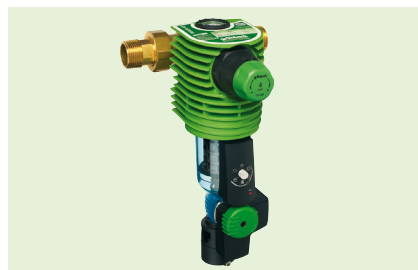
Автоматический фильтр BOXER® A/AD

Фильтровальная сетка выполнена из нержавеющей стали. Размер фильтрующей ячейки составляет 100 мкм. Простое подключение к канализации с защитой от брызг.