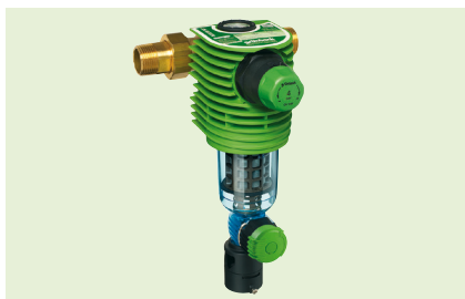
Фильтр с обратной промывкой BOXER® R/RD

BOXER® K/KD-это фильтр тонкой очистки, который гарантирует высокое качество фильтрации, является надежным и гигиеничным. Колпак фильтра выполнен из прозрачного высокопрочного материала, устойчивого к бытовым чистящим средствам. Замена картриджа производится быстро и легко без специальных инструментов. Для фильтров серии BOXER® K/KD нет необходимости подключения к канализации.