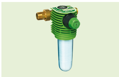
Фильтр тонкой очистки BOXER® K/KD

BOXER® K/KD-это фильтр тонкой очистки, который гарантирует высокое качество фильтрации, является надежным и гигиеничным. Колпак фильтра выполнен из прозрачного высокопрочного материала, устойчивого к бытовым чистящим средствам. Замена картриджа производится быстро и легко без специальных инструментов. Для фильтров серии BOXER® K/KD нет необходимости подключения к канализации.