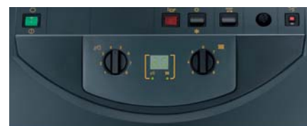
Панель со встроенным управлением водонагревателем для ГВС.

Котел GT 120 может быть оснащен 3 панелями на выбор. Стандартная панель (1) обеспечивает комфорт отопления и горячего водоснабжения. Панель Easymatic (2) поставляется с блоком дистанционного управления. Он представляет собой простой и ясный модуль, который устанавливается на панели котла, но может быть также установлен на держатель в жилом помещении. Это простое и рациональное решение. Наконец, панель DIEMATIC 3 (3) - самое технически совершенное решение. Блок дистанционного управления - диалоговый модуль заказывается дополнительно. Данная панель способна управлять всеми типами отопительных установок (нагрев бассейна, подключение солнечных коллекторов, каскад...)