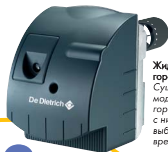
Жидкотопливная горелка M 100 Существует модификация - горелка Eco.NOx с низкими выбросами вредных веществ

Котел GT 120 оснащается новыми эффективными горелками, которые могут меняться в зависимости от типа используемого топлива. То есть, если Ваше жилище подключено к газовой сети, Вы очень легко можете заменить жидкотопливную горелку на газовую. Эти горелки с низкими выбросами NOx гарантируют качественное сгорание топлива, ограничивая выбросы вредных веществ. И, наконец, работа котла GT 120 практически бесшумна.