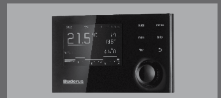
Регулятор RC 310

Преимущества Logano G124 WS/G234 WS/G234: