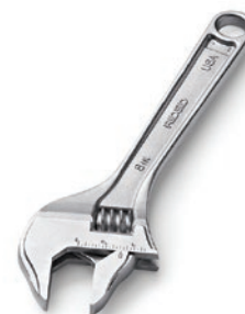
Разводной водопроводный ключ с широким зевом