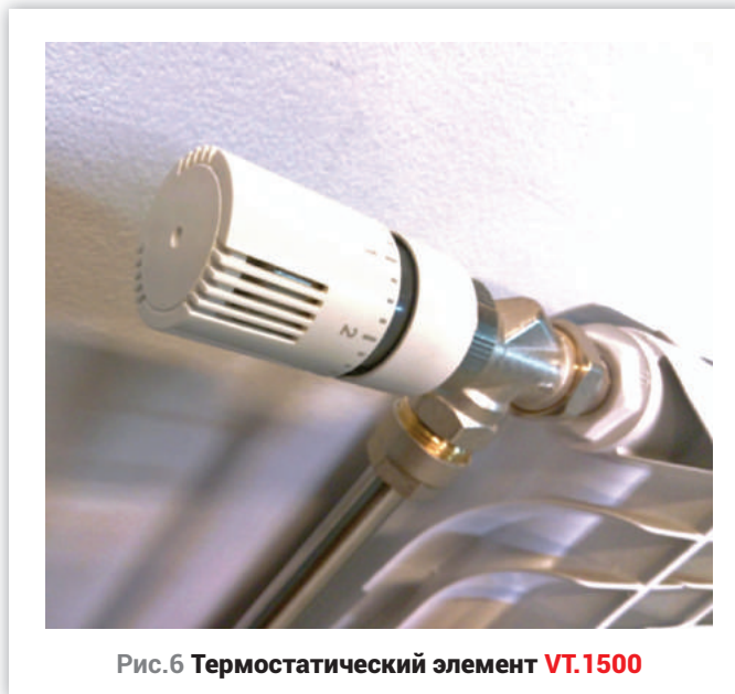
Рис.6 Термостатический элемент VT.1500

эффективные и надёжные системы отопления, а еще и в том, чтобы доводить до остальных людей информацию о том, как должна работать хорошая система отопления. Только тогда эти решения будут действительно выполнять свою функцию, а не стоять для галочки.