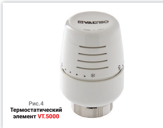
Рис.4 Термостатический элемент VT.5000