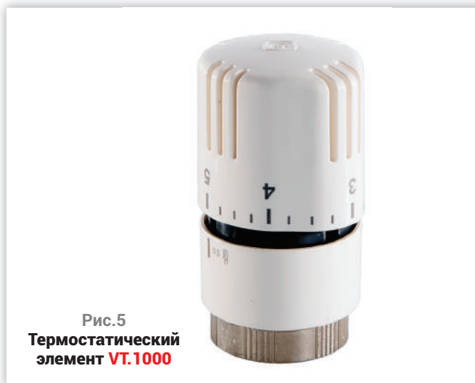
Рис.5 Термостатический элемент VT.1000

Кстати, термостатическая головка не единственный элемент, который способен обеспечить поддержание заданной температуры воздуха в помещении, эту функцию можно выполнить при помощи электронной системы автоматики, которая состоит из сервоприводов и термостатов. Подробнее об устройстве подобной системы отопления вы можете прочитать в статье «Создание теплового комфорта в помещении». Так уж вышло, что хорошую работу системы отопления многие люди воспринимают как отклонение от нормы. Задача инженеров и специалистов состоит не только в том, чтобы делать энерго-