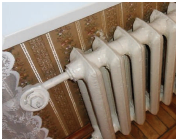
Рис.1 Радиаторный клапан, которым не пользовались уже много лет

Отсюда мы видим, что в системе отопления является нормой тот факт, что радиатор некоторое время стоит холодным. Мысль о том, что радиатор должен быть всегда горячим, возникла из-за систем отопления домов до 1990 г. постройки (а в некоторых случаях и более поздних). В таких домах хоть и ставили радиаторные клапаны, при помощи которых можно отключить поток теплоносителя, но клапаны эти, как правило, быстро закипали, ломались при частом использовании, а в некоторых случаях их покрывали таким толстым слоем краски, что повернуть его не представлялось возможным (рис.1).